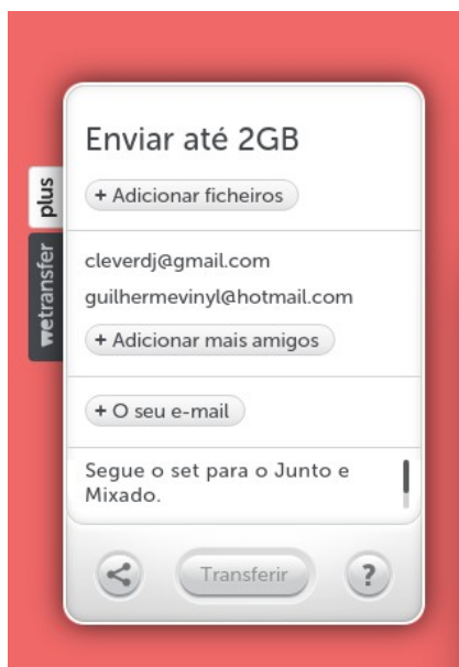
Figura 2: Tela de envio

Em seguida, na janela de envio de arquivos, adicione o arquivo MP3 clicando no botão "+Adicionar ficheiros". Depois, clique no botão "+E-mail do amigo" e escreva "cleverdj@gmail.com" e clique em "+Adicionar mais amigos" e escreva "guilhermevinyl@hotmail.com". Forneça também o seu e-mail clicando em "+O seu e-mail". Então, insira na "Mensagem" o texto "Segue o set para o Junto e Mixado". Para finalizar e enviar o bloco, clique em "Transferir". A Figura 2 ilustra uma tela de exemplo.