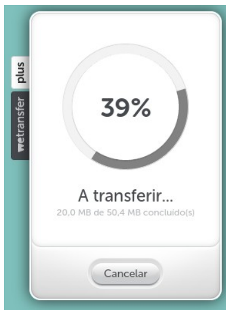
Figura 3: Tela de progresso

Aguarde o envio do arquivo acompanhando o progresso conforme a Figura 3. Dependendo do tamanho do bloco musical e da velocidade da sua conexão com a Internet, esse processo pode demorar. Ao terminar, uma tela de transferência completa será exibida de acordo com a Figura 4.