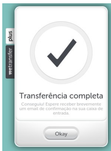
Figura 4: Processo concluído

Aguarde o envio do arquivo acompanhando o progresso conforme a Figura 3. Dependendo do tamanho do bloco musical e da velocidade da sua conexão com a Internet, esse processo pode demorar. Ao terminar, uma tela de transferência completa será exibida de acordo com a Figura 4.